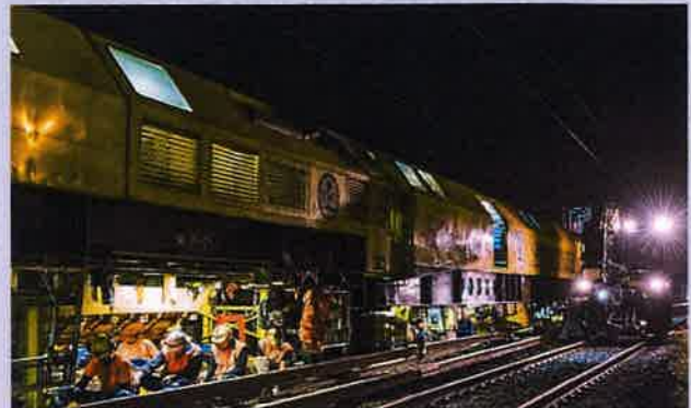
Renouvellement de rails à l'aide du train BOA